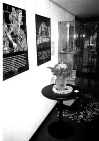
Figure 4 : Vue de l'exposition « Dieu est religions »

récentes et aux bouleversements que ces avancées ont produits sur la méthodologie de recherche, sur le rapport à la reconstruction de l'objet de recherche.