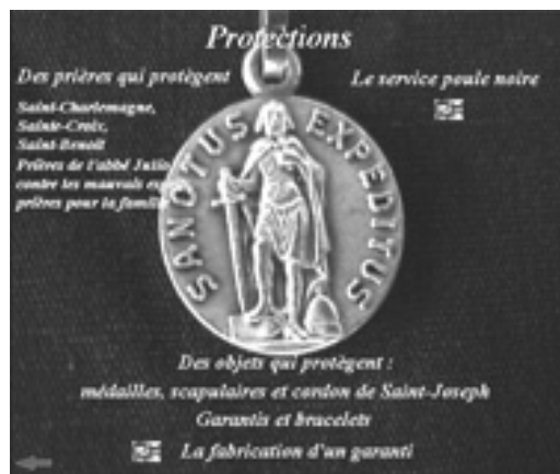
Figure 8 : Chapitre « protections » du même CD-Rom.